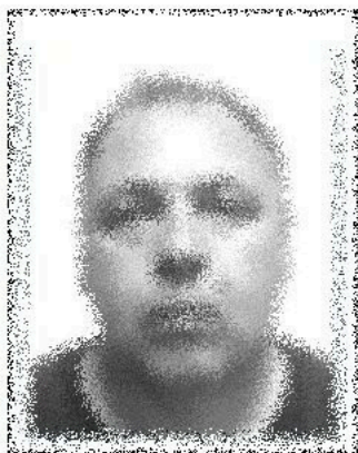
место для фотографии

Согласие на обработку моих персональных данных действует с даты его подписания, до окончания срока действия выдаваемой (заменяемой) тахографической карты. Я уведомлен(а) о своем праве отозвать настоящее согласие в любое время. Отзыв производится по моему письменному заявлению в порядке, определенном законодательством Российской Федерации.